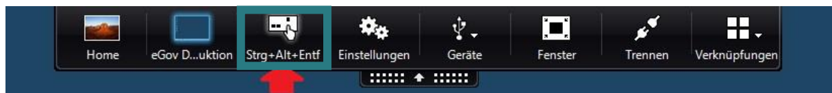
Abb. 1: Die obere schwarze Symbolleiste und Auswahl „Strg+Alt+Entf“ (roter Pfeil).

Sie können das Kennwort auch innerhalb von 90 Tagen ändern, wenn Sie bereits in der ZSVU angemeldet sind. Klicken Sie dazu auf den Pfeil am oberen Bildschirmrand und wählen Sie in der sich öffnenden Symbolleiste das Feld „Strg+Alt+Entf“ (Abb. 1).